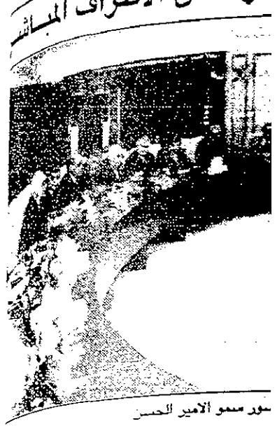
مردم الامير الحسين